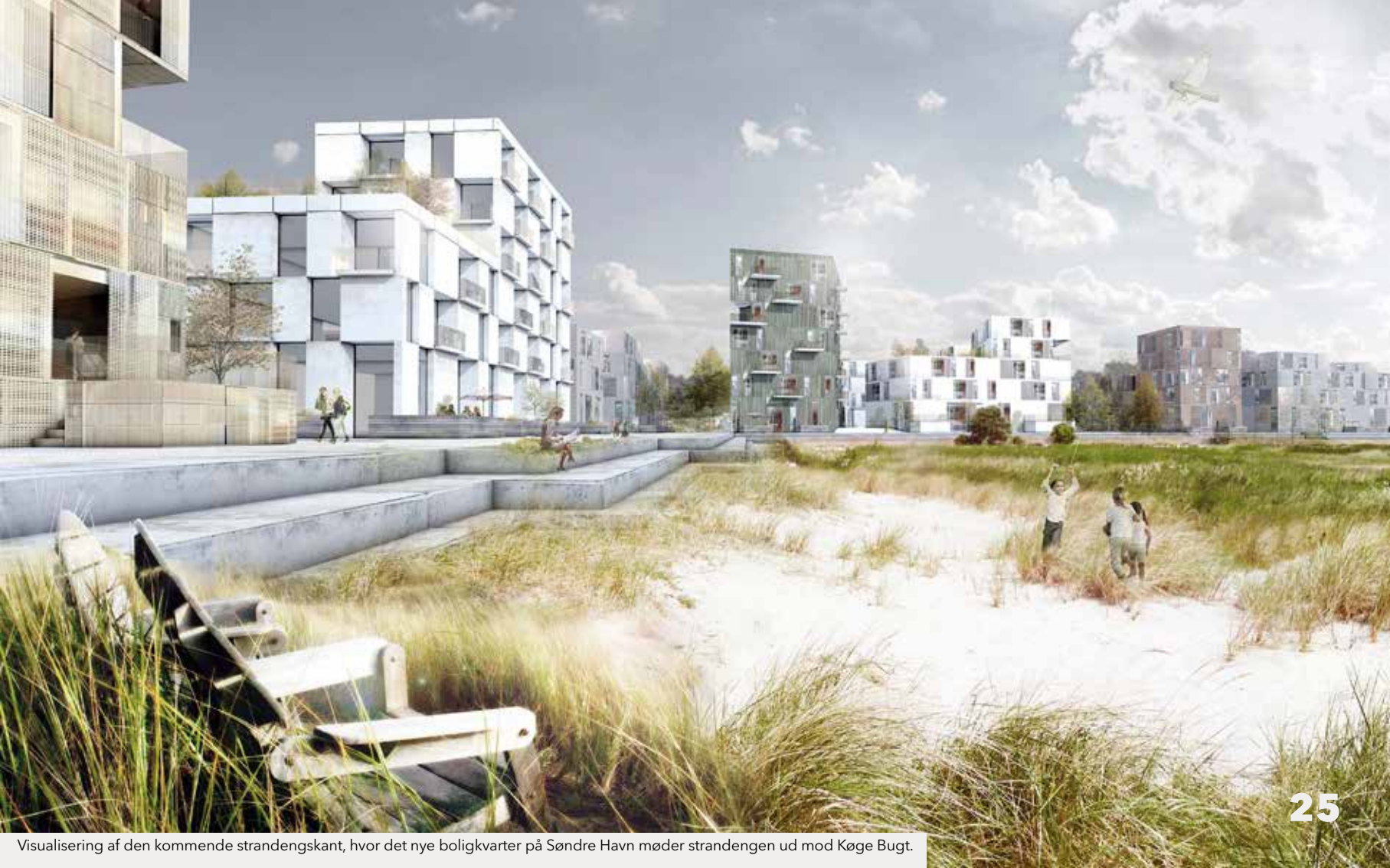
Visualisering af den kommende strandengskant, hvor det nye boligkvarter på Søndre Havn møder strandengen ud mod Køge Bugt.