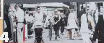
Tråden – fra Torvet til havet

Den har nu sit eget monument og kan nyde sit otium efter et langt og slidsomt liv.