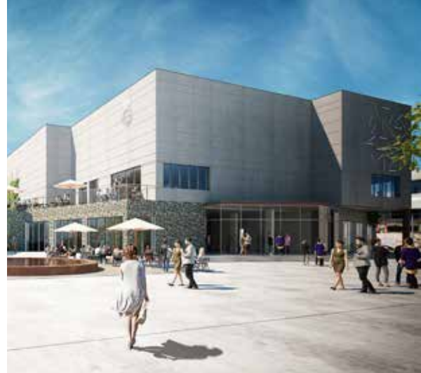
Visualisering af den kommende biografbygning ud mod Kulturtorvet. Bygningen kommer til at rumme Nordisk Film-biograf samt restaurant/butikker.

Den nye underføring starter i Apotekerhaven, som tilhørte Køge Apotek, der blev opført i 1665, og hvor der skal opføres en ny biograf. Stelen er placeret lige ved Teaterbygningen; dér, hvor underføringen kommer. For at gøre plads til underføringen og den nye Ivar Huitfeldtsvej har Køge Kyst revet dele af Teaterbygningen ned. Den oprindelige Teatervilla skal indgå i Køge Kommunes kommende kulturhus.