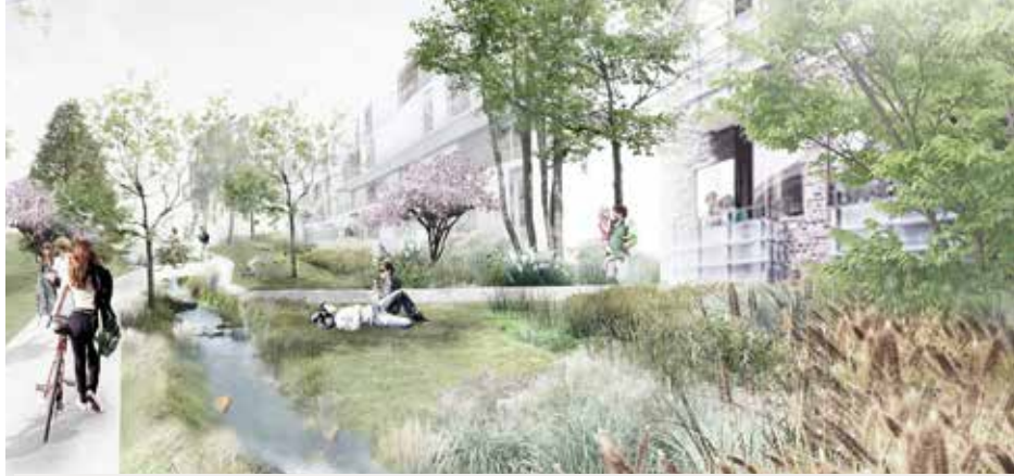
Visualisering af alminding - et grønt frirum, hvor fx regnvand benyttes som en del af de rekreative kvaliteter.

OMRÅDET blev i sin tid brugt af virksomheder, der fyldte gas på tunge gasflasker. Den tidligere tappehal ved Søndre Badevej åbnede i 2006 som Køge Kommunes ungdomskulturhus og spillested, Tapperiet - og ved siden af hallen skaber Køge Kyst her den første alminding på Søndre Havn.