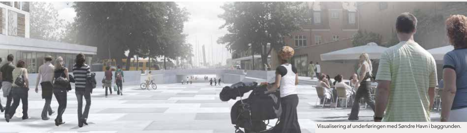
Visualisering af underføringen med Søndre Havn i baggrunden.