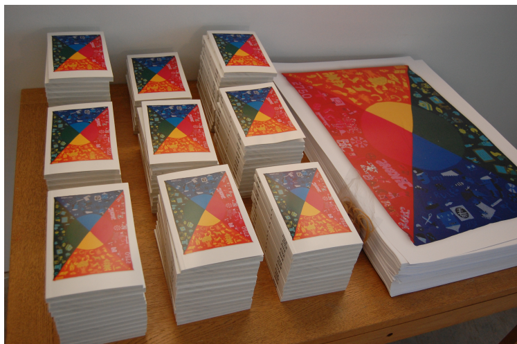
Bogen "2750 4 EVER" om Huskunstnerprojektet af samme navn. 2011

Hjemmesiden har i perioder været meget underprioriteret, så det foreslås at opdateringen lægges ind i helt faste rammer, og at en bredere formidling af Kunstrådets aktiviteter opprioriteres.