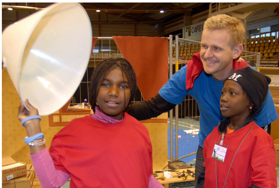
Fra det internationale projekt "Ting Taler" i Superarenaen 2011