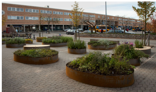
Kontorets ”Urtehaven” ved Banegårdspladsen. 2011

Det foreslås derfor at Kontoret ”genopstår” når det er oplagt. Det kan være i forhold til den fortsatte udvikling af Ballerup Bymidte, men også f.eks. i det kommende byudviklingsprojekt i Skovlunde. Finansieringen kunne fortsat være en kombination af tilskud fra Kunstrådet og midler fra konkrete byudviklingstiltag i kommunen.