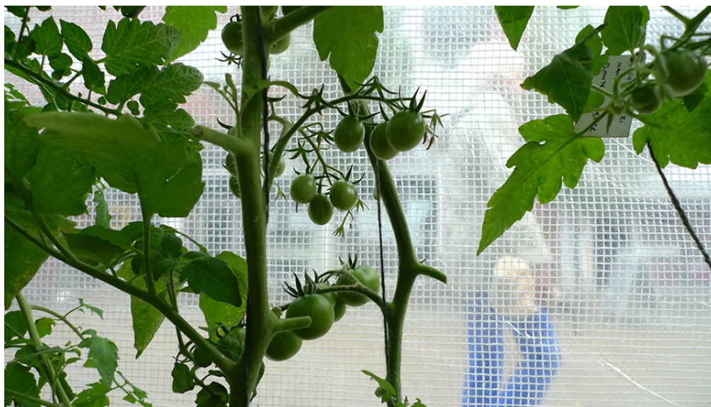
Fra Væksthuset. Kontoret for Kunsten i Byen's projekt GADEN, Centrumgaden 2013