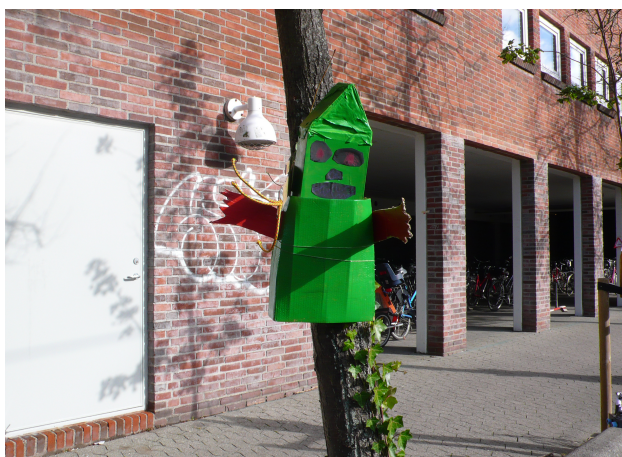
Fra street-art projektet "Hans og Grete" med Pernille Maggaard 2012

Der ligger også interessante perspektiver i kunstnere arbejder med både børn og voksne/ældre, og derfor foreslås det at Børnepuljen midler også kan gå til projekter af den karakter.