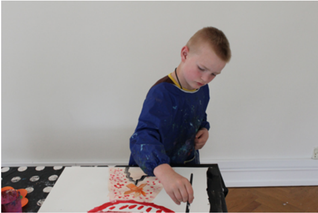
Maleprojekt til vinduesudstilling i Ballerup Centeret. Fredegården 2012

Det foreslås også der arrangeres et (måske uformelt) møde mellem Kultur- og Fritidsudvalget og Kunstrådet i slutningen af første sæson, så de to udvalg kan afstemme holdninger og forventninger.