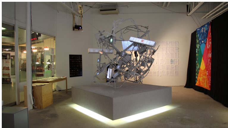
Fra udstillingen "2750 4 EVER", et Huskunstnerprojekt for Klub Syd klubberne 2011